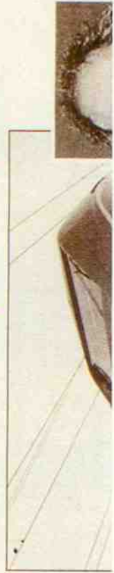
LESSANDRIA - Se in poche ore di viaggio il Frecc-

Cuttica di Revigliasco: idea semplice ma efficace contro l'isolamento